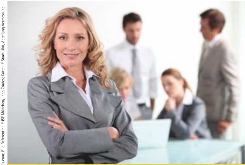
Aufgabe: 11/2014; Titelbild: © auremar - Fotolia.com; Bild Referentin: © ISF München/ Ingo Cordes; Karte: © Stadt Ulm, Abteilung Vermessung